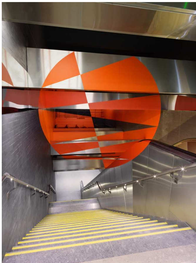
Felice Varini « Zig Zag dans le disque » Toulouse 2020 © André Morin