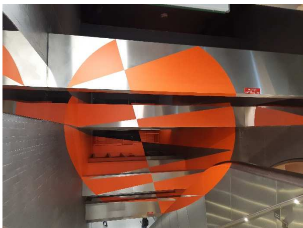
Felice Varini